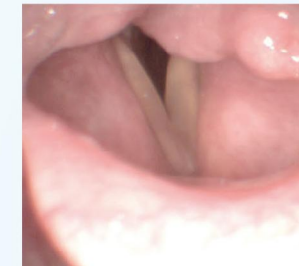
obrna levé hlasivky