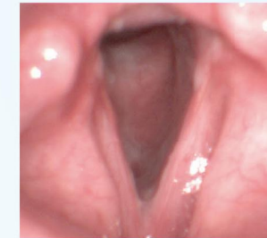
akutní zánět hrtanu

Chrapot bývá vnímán jako běžný nezávažný příznak nemoci z nachlazení. Takovýto chrapot zpravidla do 3 týdnů přejde. Trvá-li však déle, může znamenat postižení hlasivky závažnějším onemocněním, například hlasovými otoky, uzlíky, polypy, obrnou hlasivky či být příznakem postižení hlasivky nádorovým procesem. Včasný záchyt nádorových onemocnění hlasivek je základním předpokladem jejich úspěšné léčby s minimálním dopadem na organismus. Moravskoslezský kraj patří mezi oblasti s vysokým výskytem zhoubných nádorových onemocnění v oblasti hlavy a krku. V případě déletrvajícího chrapotu proto neodkládejte ORL či foniatrické vyšetření.