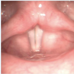
hlasivky při tvoření hlasu

Hlas je tvořen proudem vzduchu vydechaného z dolních dýchacích cest, který rozkmitává sliznici k sobě přiložených hlasivek a dále je zesilován v rezonančních dutinách (např. vedlejší nosní dutiny), kde získává charakteristickou barvu.