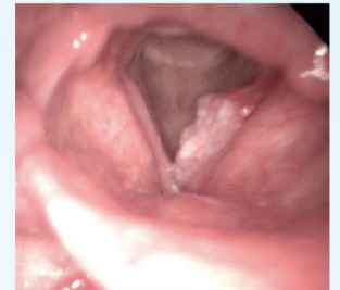
zhoubný nádor levé hlasivky